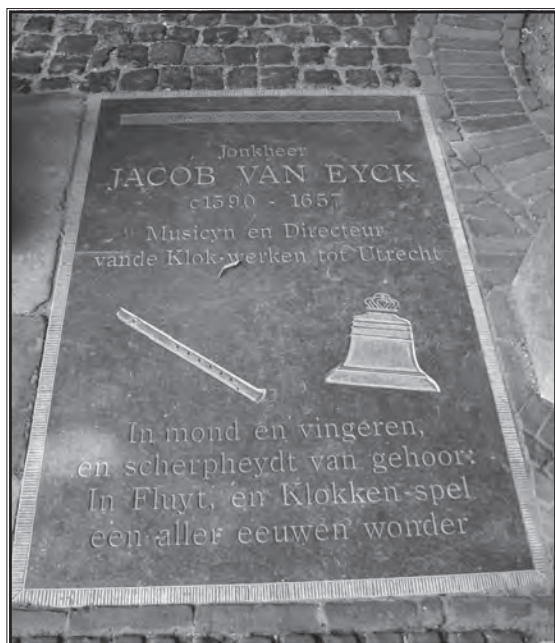
De gedenksteen op het Domplein

werking geweest met de klok-kengieters François en Pieter Hemony, die afkomstig waren uit Lotharingen. In 1642 vervaardigden zij hun eerste Nederlandse carillon, voor de Wijnhuistoren van Zutphen. Daarna kwam Deventer aan de beurt. En dat alles met medewerking van Van Eyck. Uiteraard probeerde de jonker ook Utrecht aan instrumenten van Hemony te helpen. De Jacobikerk had in 1653 de primeur. Dit instrument is niet bewaard gebleven, het stortte naar beneden bij de tornado die Utrecht in 1674 trof. Het kleine Hemony-spel van de Nicolaïkerk is er nog wel. Van Eyck heeft het echter nooit kunnen bespelen, het werd er geïnstalleerd in het voorjaar van 1657, toen de meester al op zijn sterfbed lag. De plaatsing van een Hemony-beiaard in de Domtoren heeft hij niet mogen beleven, die droom is pas in 1664 werkelijkheid geworden. Een Hemony wordt nog altijd beschouwd als de Stradivarius onder de carillons.