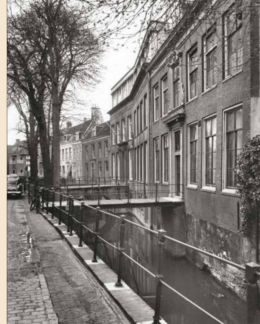
Bonifacius-Lyceum met het toegangsbruggetje, Kromme Nieuwegracht 3, ca. 1950.