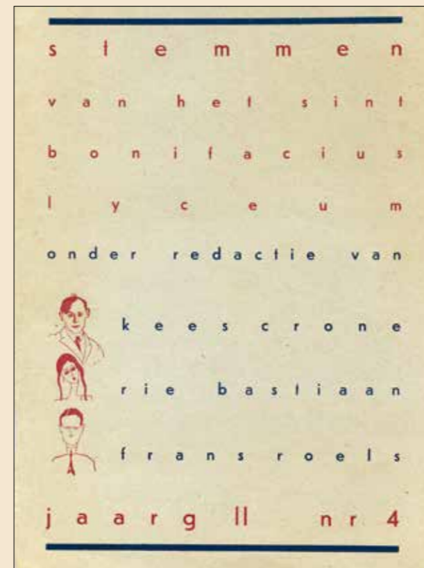
Omslag Stemmen septembernummer 1933.