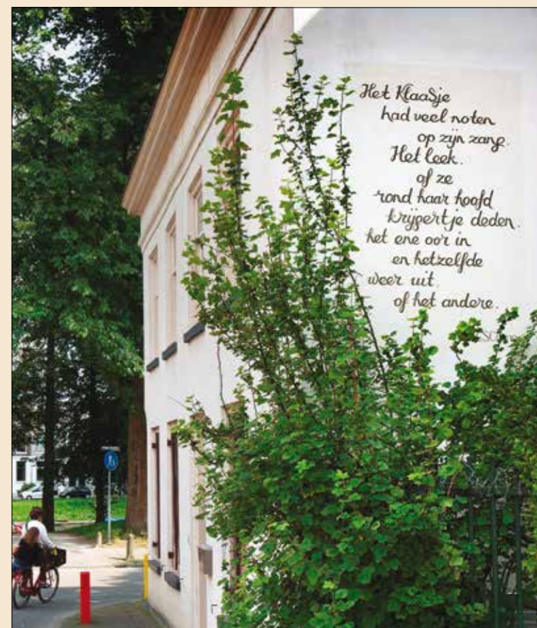
Een tekst uit 'Muziek over het water' op een zijgevel Nicolaas Dwarstraat.