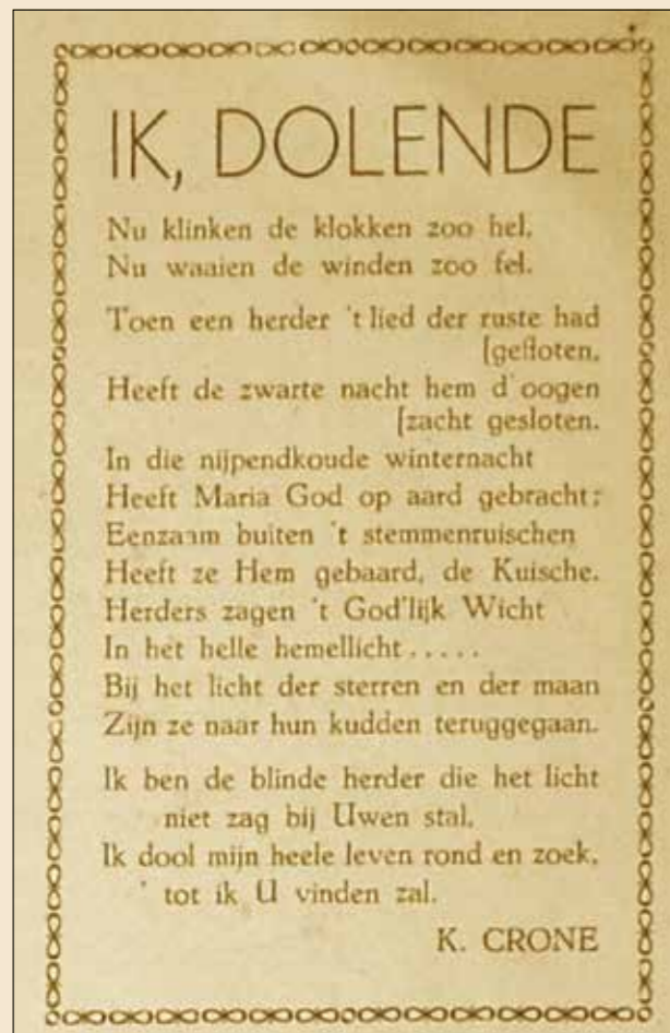
Het gedicht 'Ik dolende', gepubliceerd in het kerstnummer van Het Centrum , 24 december 1930.

op het Bernardus ook zeer gestimuleerd. In de Limburgse studietijd verscheen zijn werk voor het eerst in een echte krant: op 24 december 1930 publiceerde het katholieke dagblad Het Centrum z'n gedicht Ik dolende . Er bleek na drie jaar geen roeping voor het priesterschap.