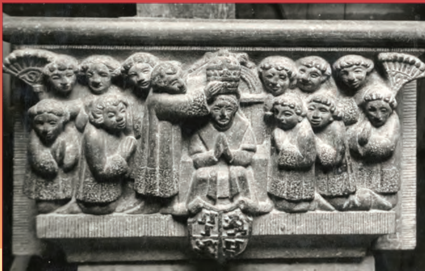
De door de beeldhouwer C.J. Groeneveld vervaardigde console 'De kroning van Paus Adriaan' op 31 augustus 1522, voor de plaatsing in 1969 ter hoogte van het huis Oudegracht 265 te Utrecht.