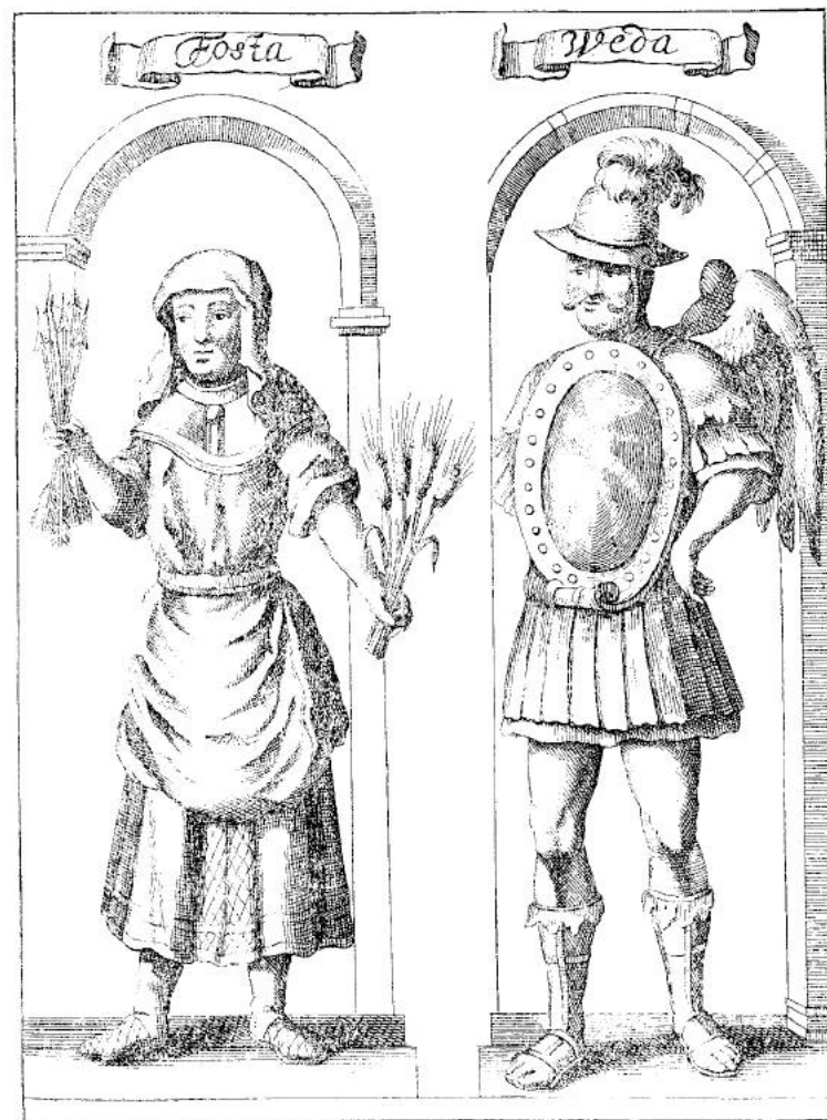
2. Fosta en Weda, volgens Trogillo Arnkiel's kroniek van 1691.