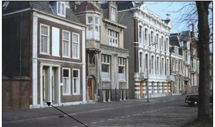
Voordeur van Maliebaan 72 bis (bovenhuis, linker deur) en 72. Rechts daarvan de panden 74 (SD) en 76/78 (WA). Cat.nr. 20636 datering 2/3/1969.

Haar vaste vriend was Gerrit van Wijhe, 1908-1999, die er in 1936 direct voor zorgde dat zij als alleenstaande vrouw ter bescherming een hond in huis had, een jonge boxer. Gerrit had een 6-jarige HBS opleiding zonder diploma, voetbalde bij Hercules in het 1 e elftal, haalde in 1936 als één van de eersten een diploma Oefenmeester van de KNVB en later ook diploma's sportmassage en pedicure.