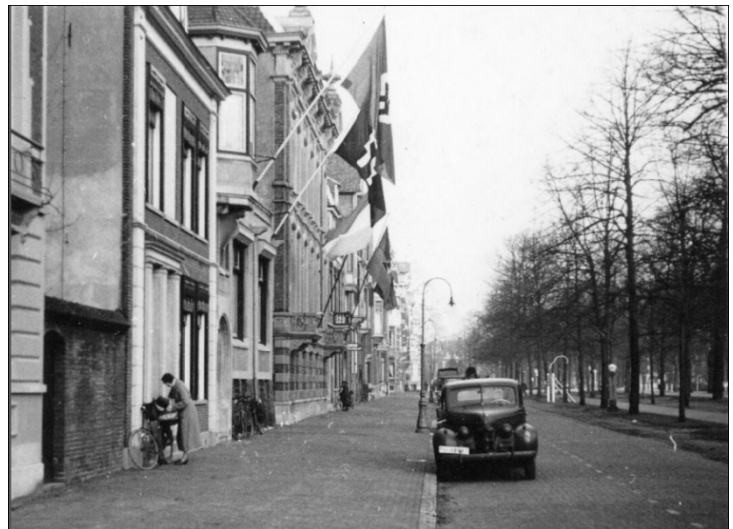
Hetzelfde rijtje huizen aan de Maliebaan in oorlogstijd. Op de nrs 74 en 76/78 hangen de Germaanse vlaggen uit. Cat.nr. 603100.