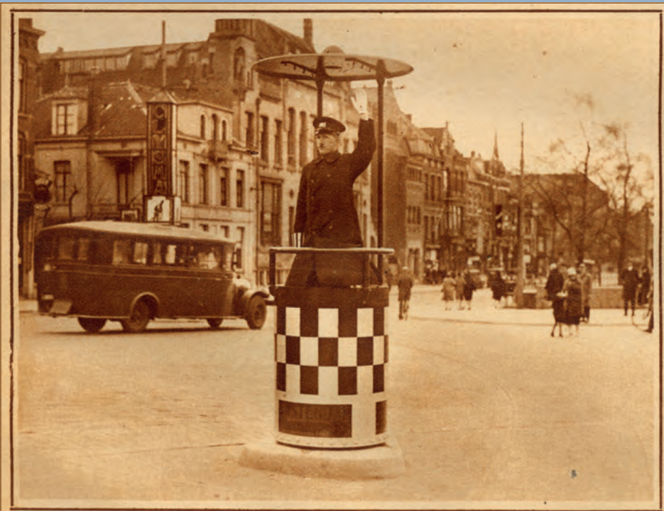
In navolging van andere wereldsteden heeft Utrecht ook iets nieuws op verkeersgebied gepresteerd. Daar kan men nu den verkeersagent op de Smokkelaarsbrug in een ketel zien staan waar hij uit de hoogte op het mensdom neerziet.

Utrecht in Woord en Beeld, 5 april 1929.