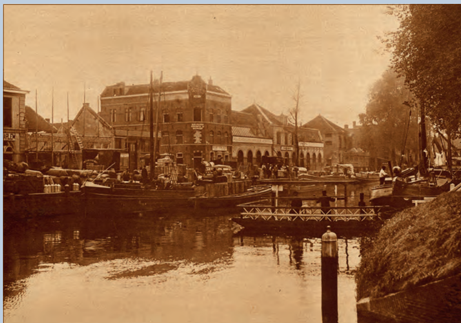
'Een kiek, genomen op de Nieuwe kade met het bekende overhaalschuitje', een foto gepubliceerd 27 oktober 1927.

De uitgeverij startte toen naast Utrecht in Woord en Beeld de bladen Gelderland in Woord en Beeld (Arnhem), Het Noorden in Woord en Beeld (Groningen), Van Eigen Erf (Zwolle) en Fen Fryske Groun (Leeuwarden). Ze hadden grotendeels dezelfde inhoud; enkele fotopagina's en de sportrubriek werden regionaal ingevuld. Het blad ademde een eigen sfeer door de uitvoering in sepia koperdiepdruk. In september 1938 nam De Geïllustreerde Pers de uitgave over. Het aandeel 'Utrecht' nam daarna langzaam af. Per 1 januari 1942 werd een verschijningsverbod opgelegd 'vanwege papierschaarste'. Na de oorlog verscheen het blad nog enkele jaren om uiteindelijk in 1949 op te gaan in de Wereld in Beeld . Jammer genoeg zijn er geen oplagecijfers