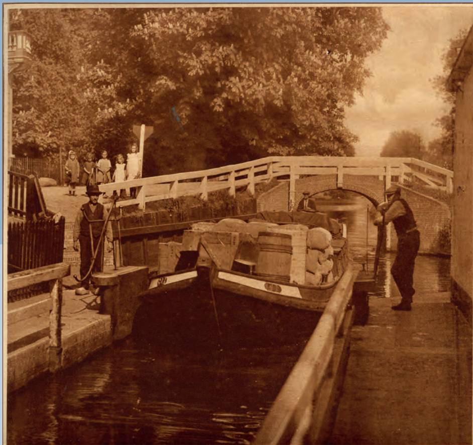
HET OUDE SLUISJE IN DEN OUDEN RIJN AAN DEN STADSDAM TE DE MEERN

Zijn fotowerk was wel grotendeels aan de stad gewijd. Met enige regelmaat fotografeerde hij in dichtbij gelegen gemeenten als Zuilen, Vleuten, De Meern, De Bilt, Jutphaas en Zeist en een enkele keer maakte