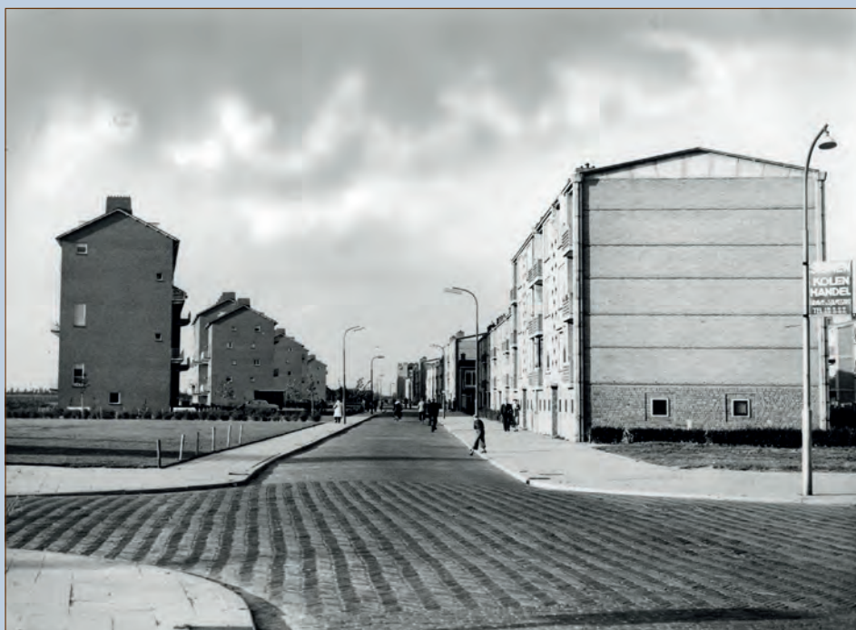
Troelstralaan te Utrecht met pas opgeleverde flats, ca. 1953.

HUA, Archief van de N.V. Koninklijke Nederlandse Jaarbeurs te Utrecht, toegangsnr. 836. HUA, Kamer van Koophandel Utrecht: handelsregister, toegangsnr. 4004. Bardoel, Jo en Wijfjes, Huub (redactie), Journalistieke cultuur in Nederland (Amsterdam 2015). Hemels, Joan en Vegt, Renée, Het Geïllustreerde Tijdschrift in Nederland (Amsterdam 1993). Utrecht in Woord en Beeld, 1925-1942 (Nederlands Volksbuurtmuseum en HUA). Utrechtsch Nieuwsblad, 1925-1958 . Gesprekken met J.L. Lauwers (kleinzoon).