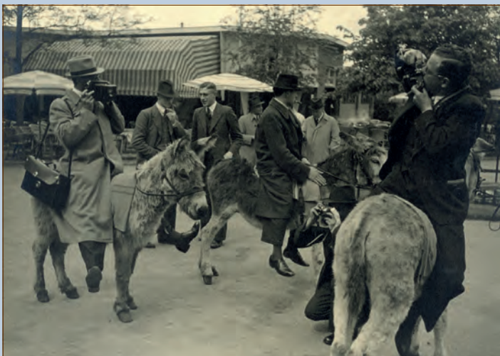
Persfotografen vermaken zich kostelijk in Ouwehands Dierenpark, tijdens hun tour door de provincie Utrecht, 25 mei 1938.

Daarna werkte hij voornamelijk in opdracht. In het archief van de Jaarbeurs bevindt zich een serie van zijn hand met foto's van publiek dat zich op de beurs in april 1948 vergaapt aan nieuwe machines: het is de begintijd van de wederop-