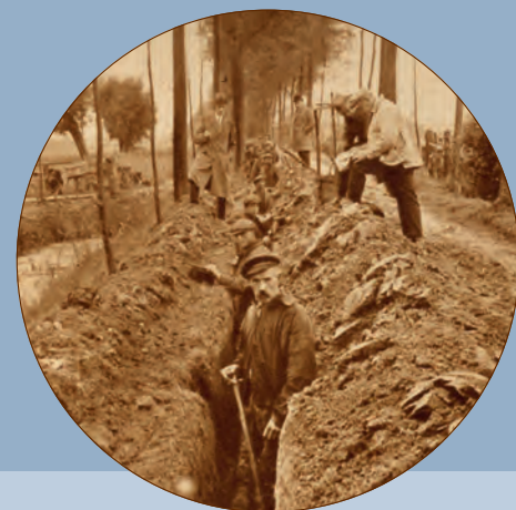
Een van de vier foto's van een reportage over aanleg drinkwaterleiding in Vleuten, foto gepubliceerd 8 juli 1927.

Over de precieze rol die opa Lauwers in het verzet speelde, heerst verwarring, volgens zijn kleinzoon. Dat komt omdat zijn vader, met dezelfde initialen 'G.J.', roepnaam 'Jink' (1915-1991) en óók persfotograaf, eveneens actief was in het verzet. Uit de correspondentie die kleinzoon in 1995 voerde met de Stichting 1940-1945, blijkt dat beiden hun sporen hebben verdiend, maar dat er soms sprake lijkt van persoonsverwisseling.