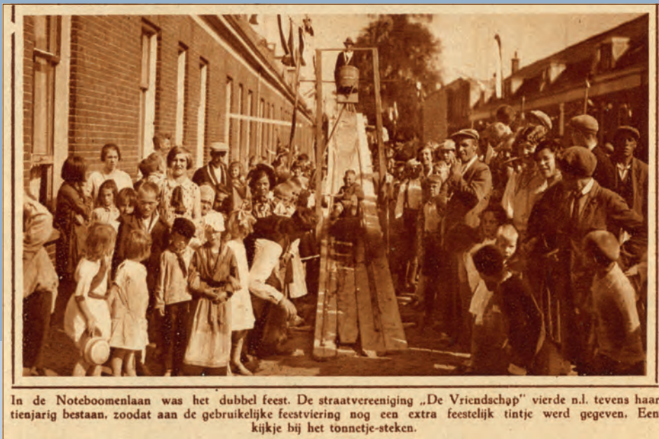
In de Noteboomenlaan was het dubbel feest. De straatvereniging „De Vriendschap” vierde n.l. tevens haar tienjarig bestaan, zoodat aan de gebruikelijke feestviering nog een extra feestelijk tintje werd gegeven. Een kijkje bij het tonnetje-steken.

Utrecht in Woord en Beeld, 5 september 1930.