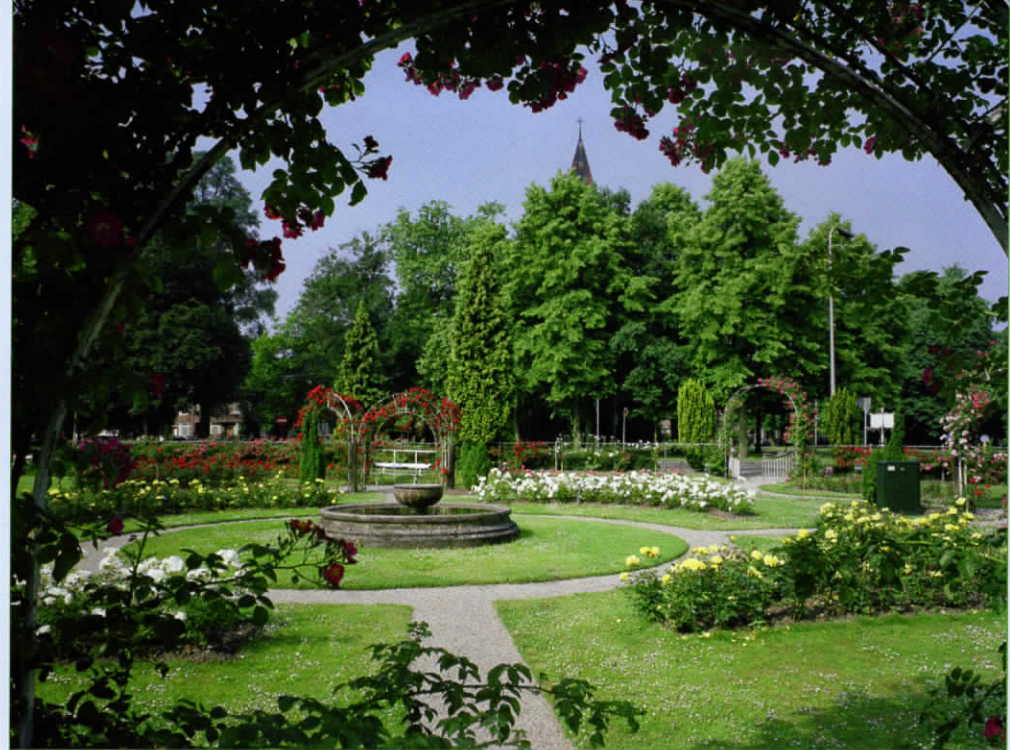
Het Rosarium in 1993.

Bij de oprichting was het gemeentebestuur met NJR overeengekomen, het Rosarium gratis in bruikleen te geven. Bovendien kreeg de vereniging gelegenheid om op één van de gemeentelijke kwekerijen proefvelden voor rozen aan te leggen. Het plantmateriaal voor die proefvelden en het rosarium werden geleverd en bekostigd door NJR, terwijl bewerking en bemesting van de grond alsmede de dagelijkse zorg voor het rozenpark voor rekening van de gemeente kwamen. Toezicht op het onderhoud was opgedragen aan een commissie, bestaande uit één persoon namens NJR en de opzichter van de Utrechtse plantsoenen. Een en ander lag vast in een schriftelijke overeenkomst die vanaf 1916 iedere tien jaar zonder problemen verlengd werd. In 1956 leek het aanvankelijk goed te gaan tot de vereniging begin 1957 het contract opzegde, omdat ze door terugloop van het ledental niet meer aan haar verplichtingen kon voldoen. B & W namen daar met spijt kennis van 'omdat aldus een einde moet komen aan de aangename, sedert 1911 bestaan hebbende samenwerking tussen de gemeente en uw vereniging. [...] Voor de arbeid en de moeiten, die uw vereniging