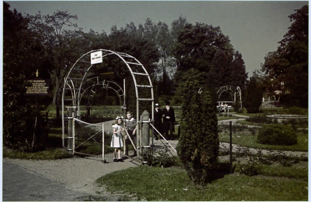
'Voor Joden verboden', gefotografeerd in 1942.