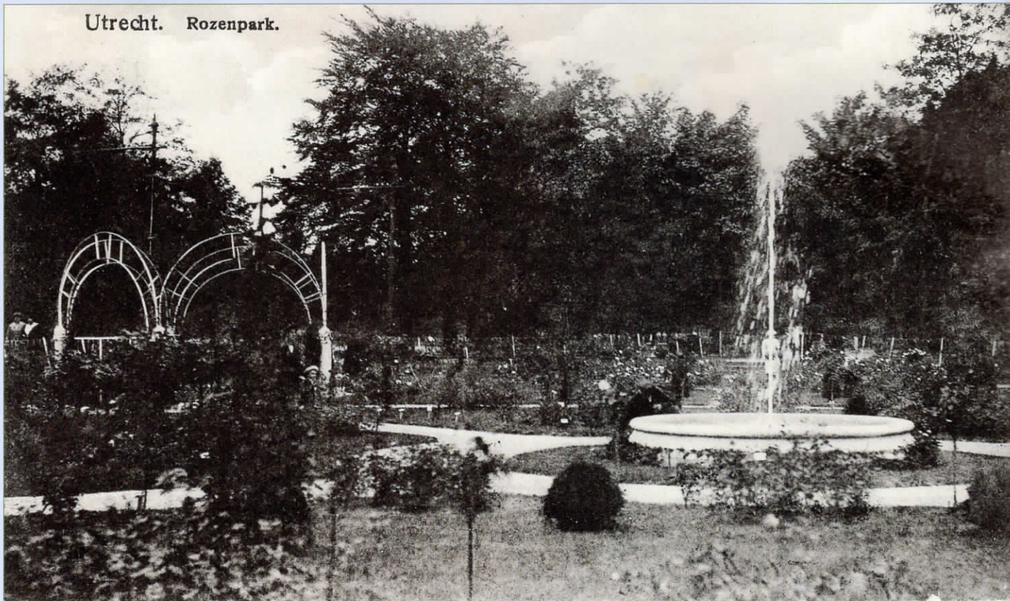
Ansichtkaart van het Rosarium, kort na de opening, 1913. Dit is de oudst bekende foto van het rozenpark.