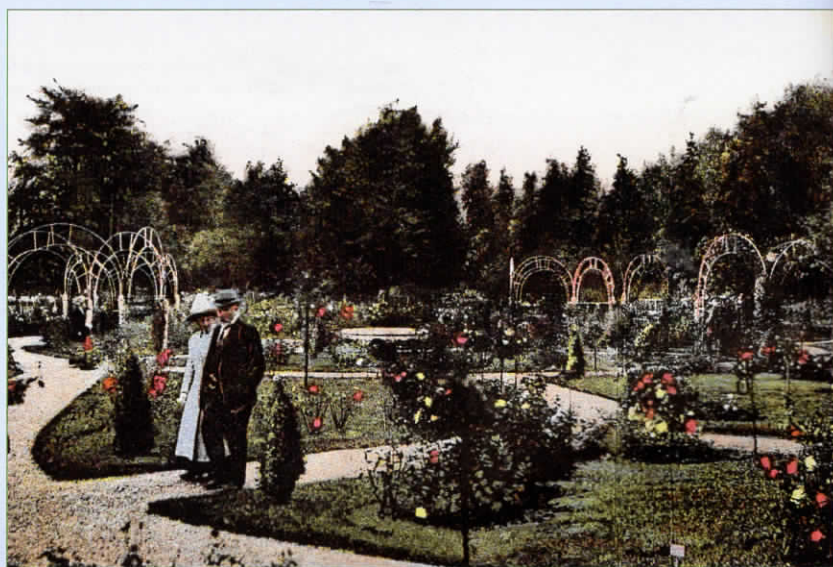
Het 'mooiste plekje van Utrecht' in 1922.

maaiveld. Het talud dat het park van de omgeving scheidde, werd beplant met klimop en een rand Buxus suffruticosa (Voetpalm). Om de eentonigheid van de verzameling bloemen van één soort te breken liet de plantsoenmeester in het midden ruimte voor een vaas, fontein of zonnwijzer (het werd uiteindelijk een fontein). Het ontwerp voorzag verder in 11 plantvakken met in totaal 144 bedden. De rozenkwekers van NJR zagen kans om daarin steeds 160 tot 200 soorten en variëteiten in bloei te krijgen: struikrozen, stamrozen en leirozen in de kleuren licht- tot donkerrood, geel, wit en rose. Op foto's uit de beginjaren maakt het Rosarium dan ook een overvolle indruk, een kakofonie van kleuren, maar bij het publiek van die tijd dwong dat juist bewondering af.