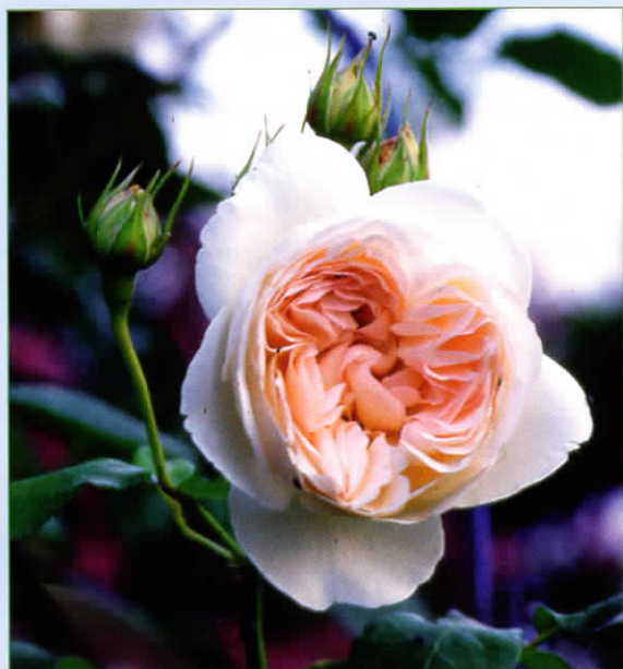
Rosa 'Sebastiaan Kneipp' , een van de rozen in het huidige Rosarium, genoemd naar de Beierse priester die als grondlegger van de natuurgeneeskunde wordt beschouwd.

Om het publiek voor te lichten over de verschillende variëteiten en om de kwekers reclame te laten maken kreeg iedere roos een emaille bordje met, volgens de Nieuwe Rotterdamse Courant in 1919: 'een uittreksel uit haar geboorteregister en uit haar staat van dienst. En men ziet op de kronkelende paden tusschen de rozen