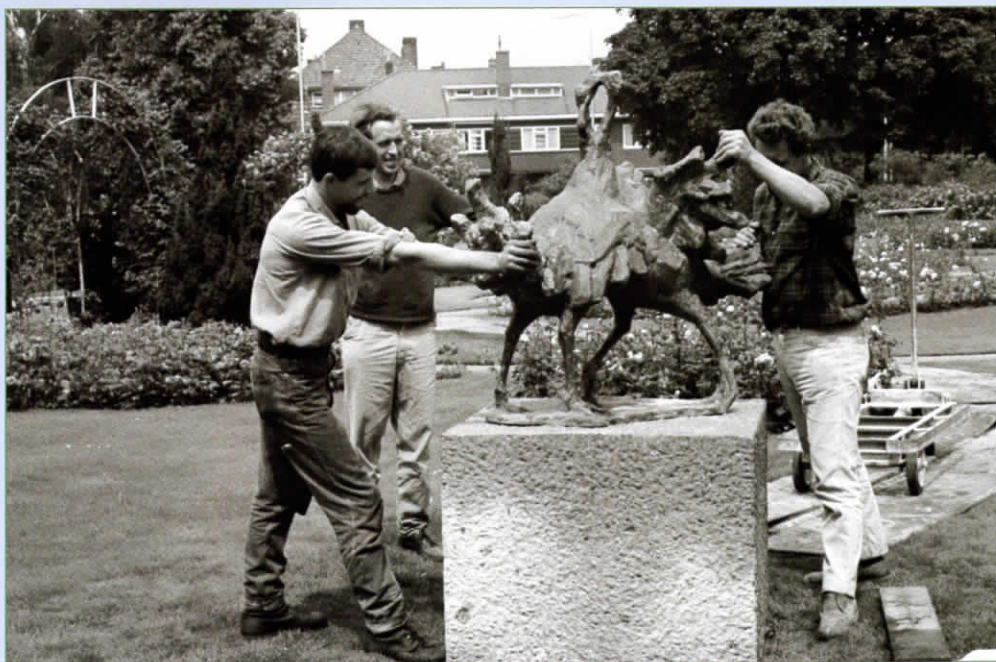
Plaatsing van het beeld 'Vechtende Kalkoenen' van de beeldhouwer Th. Mulder (2e van links) op 21 juli 1965.

□ FOTO L.H. HOFLAND | HET UTRECHTS ARCHIEF, COLLECTIE BEELDMATERIAAL