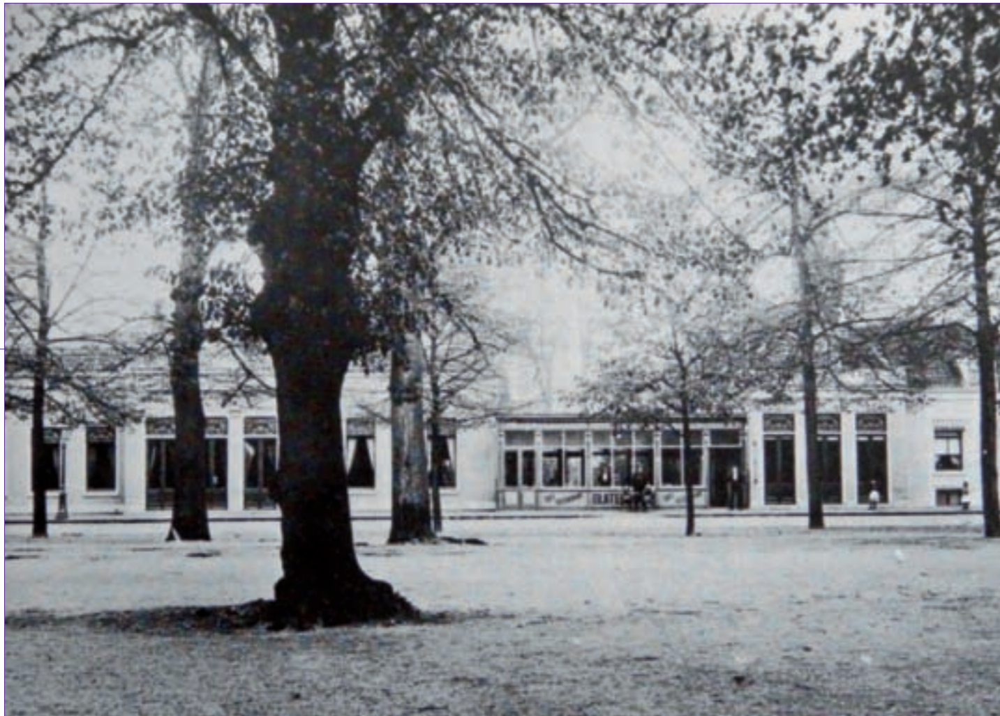
Café Buitenlust omstreeks 1900.