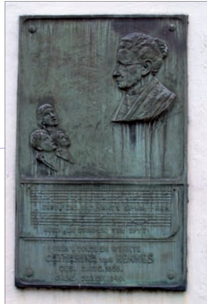
Plaquette op de gevel van Brigittenstraat 1

'Bij het volk, dat vrijheid bemint als het leven, Welkom o vrouwen al te gaer! Gij, die vruchten vraagt van uw ijvren en streven, Pleit voor wat goed is, rein en waar!'